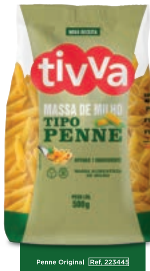
Penne Original Ref. 223445