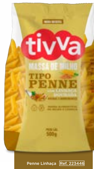
Penne Linhaça Ref. 223446

APENAS 2 INGREDIENTES FARINHAS DE MILHO E DE LINHAÇA DOURADA