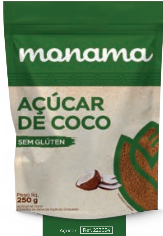
Açúcar Ref. 223654

Ideal for lactose intolerant and allergic individuals. Vegan. Low carb. Source of good fats. Super creamy