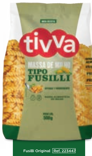
Fusilli Original Ref. 223447

APENAS 2 INGREDIENTES FARINHAS DE MILHO E DE QUINOA BRANCA