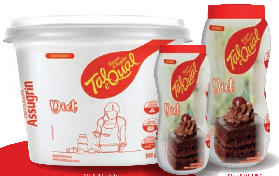
TAL E QUAL 500 G