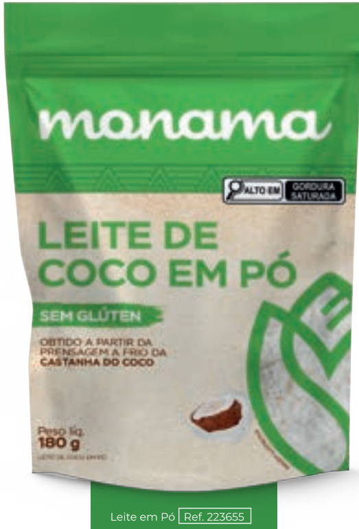
Leite em Pó Ref. 223655

VERSATILE, TASTY OPTIONS, RICH IN FIBERS, VITAMINS, AND MANY MINERALS. IDEAL VERSIONS FOR EVERYDAY SUBSTITUTIONS.