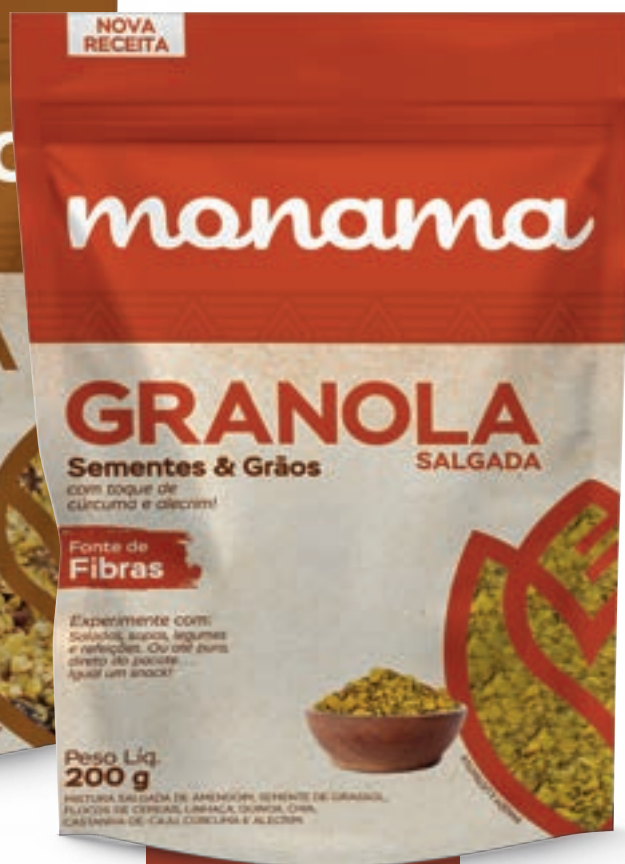
Alecrim e Cúrcuma Ref. 223441