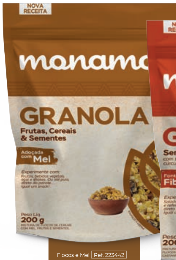
Flocos e Mel Ref. 223442