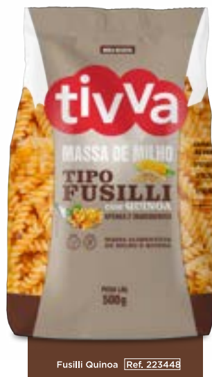
Fusilli Quinoa Ref. 223448

APENAS 2 INGREDIENTES FARINHAS DE MILHO E DE QUINOA BRANCA