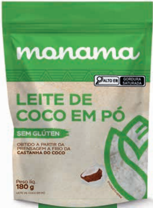
Leite em Pó Ref. 223655

VERSATILE, TASTY OPTIONS, RICH IN FIBERS, VITAMINS, AND MANY MINERALS. IDEAL VERSIONS FOR EVERYDAY SUBSTITUTIONS.