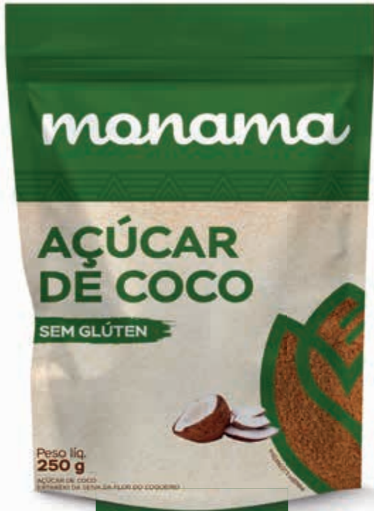
Açúcar Ref. 223654

Ideal for lactose intolerant and allergic individuals. Vegan. Low carb. Source of good fats. Super creamy