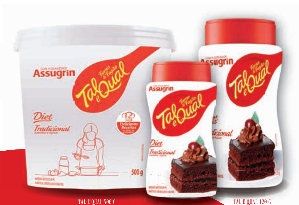
TAL E QUAL 500 G