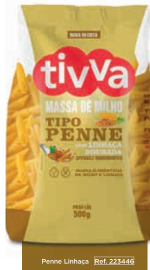
Penne Linhaça [Ref. 223446]

APENAS 2 INGREDIENTES FARINHAS DE MILHO E DE LINHAÇA DOURADA