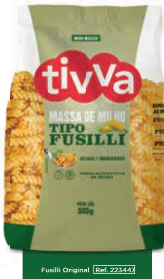
Fusilli Original [Ref. 223447]

APENAS 2 INGREDIENTES FARINHAS DE MILHO E DE QUINOA BRANCA