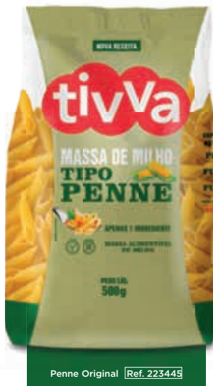
Penne Original [Ref. 223445]