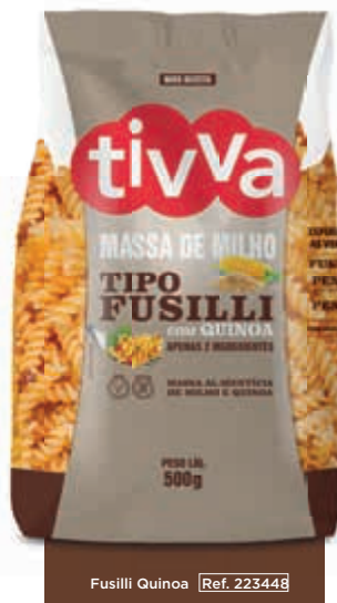
Fusilli Quinoa [Ref. 223448]

APENAS 2 INGREDIENTES FARINHAS DE MILHO E DE QUINOA BRANCA